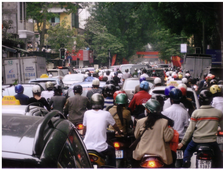
バイクと車の洪水

小、中学校は二部制 で、朝七時からと午後 一時からの授業。ベト ナムは外食文化。朝食 もほとんど外食で、小 学生が親と朝早くから 屋台でフォードと呼ばれ るうどんのようなめん