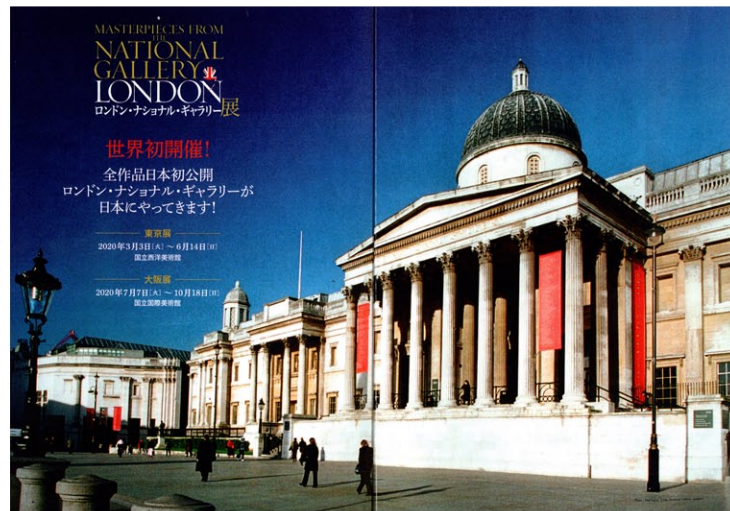
完全ガイドブックで紹介されているナショナル・ギャラリーの外觀

このギャラリーは、すべての人に芸術鑑賞と教育の機会を提供している。展示室には十分な広さがあり、中央にソファが置かれ、座ってゆっくり鑑賞できる場所もある。美術学生らしき若者が熱心に横写に励んでいる。フラッシュをたかなければ写真も自由に撮れる。